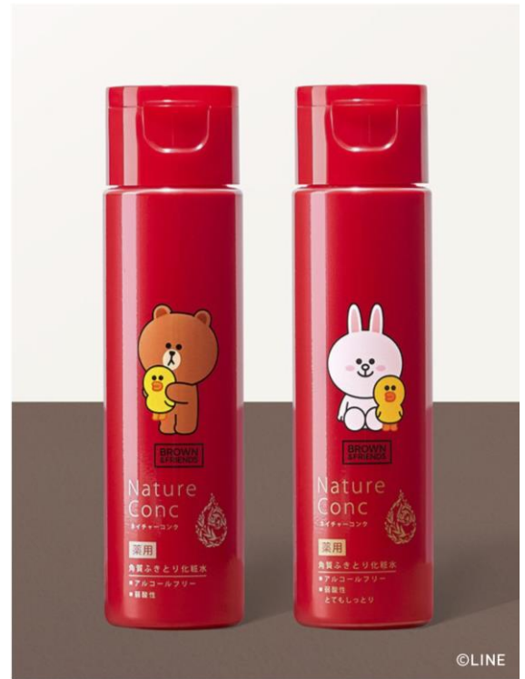
左：ネイチャーコンク 薬用 クリアローション（限定デザイン） 右：ネイチャーコンク 薬用 クリアローション とてもしっとり（限定デザイン）

10日は、ふきとり化粧水シェア No.1 を記念し、「ふきとりの日」として日本記念日協会に申請し、認定されています。当社では、自社ブランドだけでも、10 を超えるふきとり化粧水を販売。流通に適した情報や化粧品を提供したいと考え、流通ごとにブランドを変えていますが、ドラッグストアなどで扱う一般流通におけるふきとり化粧水は「ネイチャーコンク」のみです。